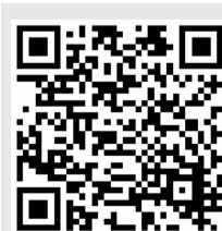
扫码听诗朗诵 《我亲爱的祖国》

周年,她也在用自己的声音诵读经典,为党庆生,并获得“诵读中华经典 献礼建党百年”主题诵读一等奖。在今年双井街道创享计划中,她提出了以趣味活动开展普通话练习的建议,得到专家评委的一直认可。后续,街道及社区也将开展相关活动,大力推广普通话。