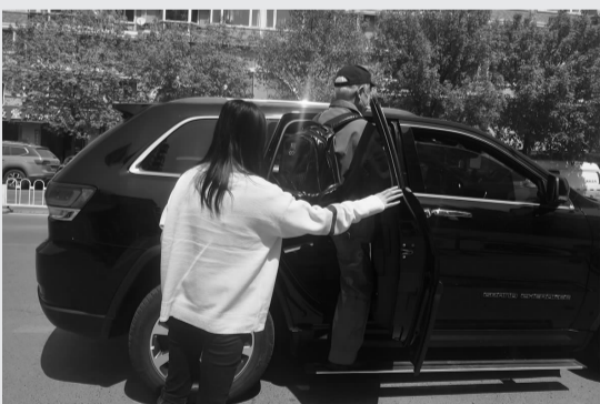
社工开车送居民前往医院住院