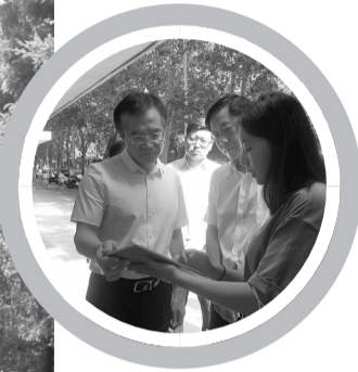
▲查看沿街商户“门前三包”责任牌