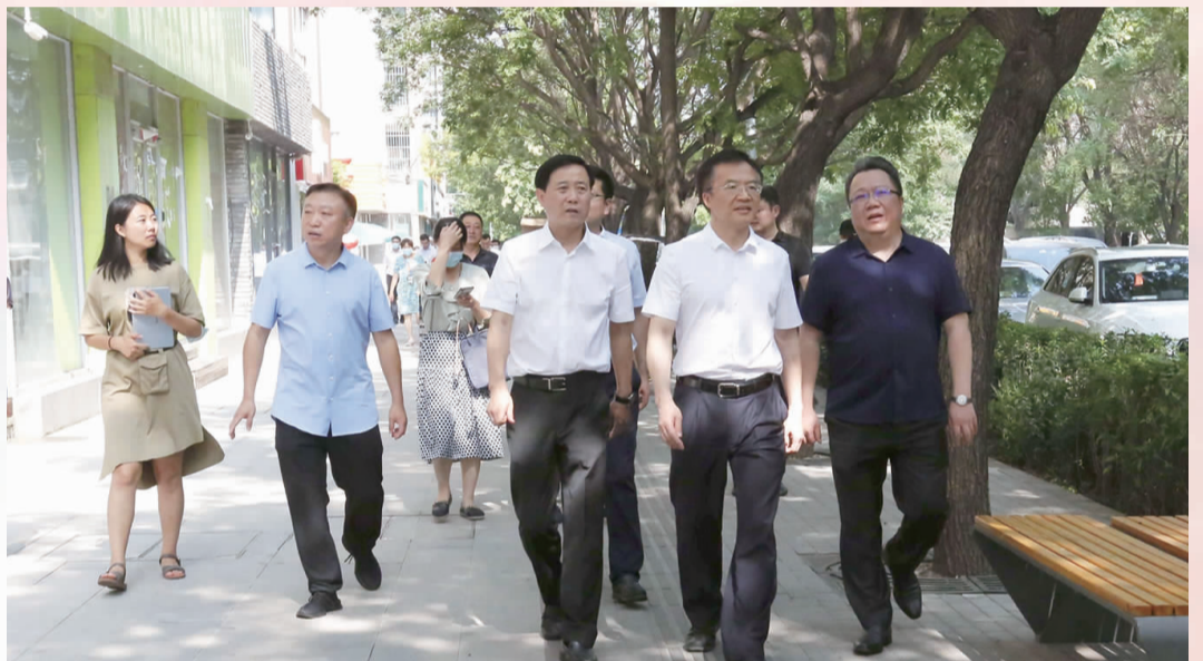
朝阳区区长文献带领区相关部门到双井街道围绕“门前三包”工作开展走访调研

打造品牌亮点,以建党 100 周年为契机,打造“1+2+3+N”党建工作体系,深化地区党建协调委员会平台,完善“五大专委会”设置,继续推进实施物业服务提升项目、“乡村振兴”帮扶等“六大项目”,党建引领社会治理水平进一步提升。深化“1·3 社区”品牌内涵,强化社会动员。继续优化温馨家园“1+N”功能布局。广大党员干部要深刻学习领会习近平总书记在党史学习教育动员大会上的重要讲话精神,做到学史明理、学史增信、学史崇德、学史力行,做到学党史、悟思想、办实事、开新局。