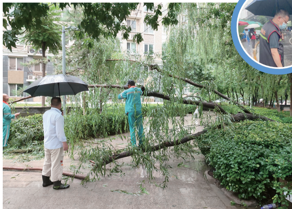
工作人员冒雨清理倒伏的树木